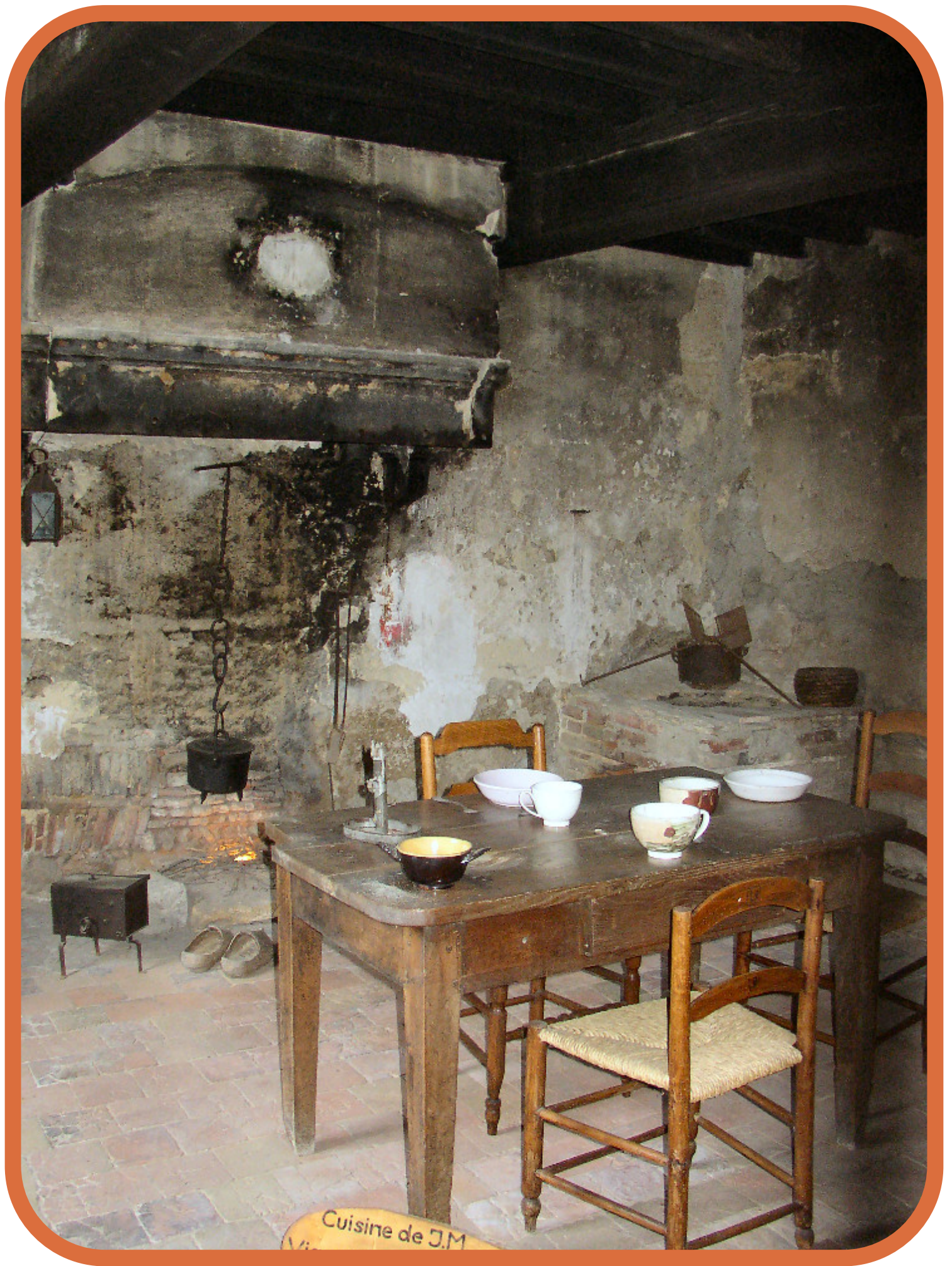
Cocina de San Juan María Vianney