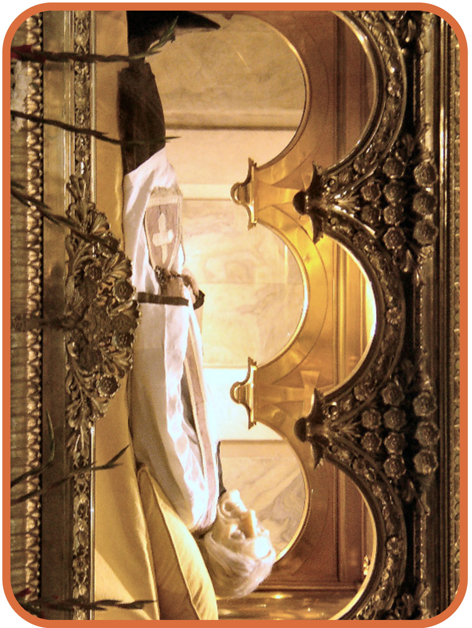
Cuerpo incorrupto del cura de Ars