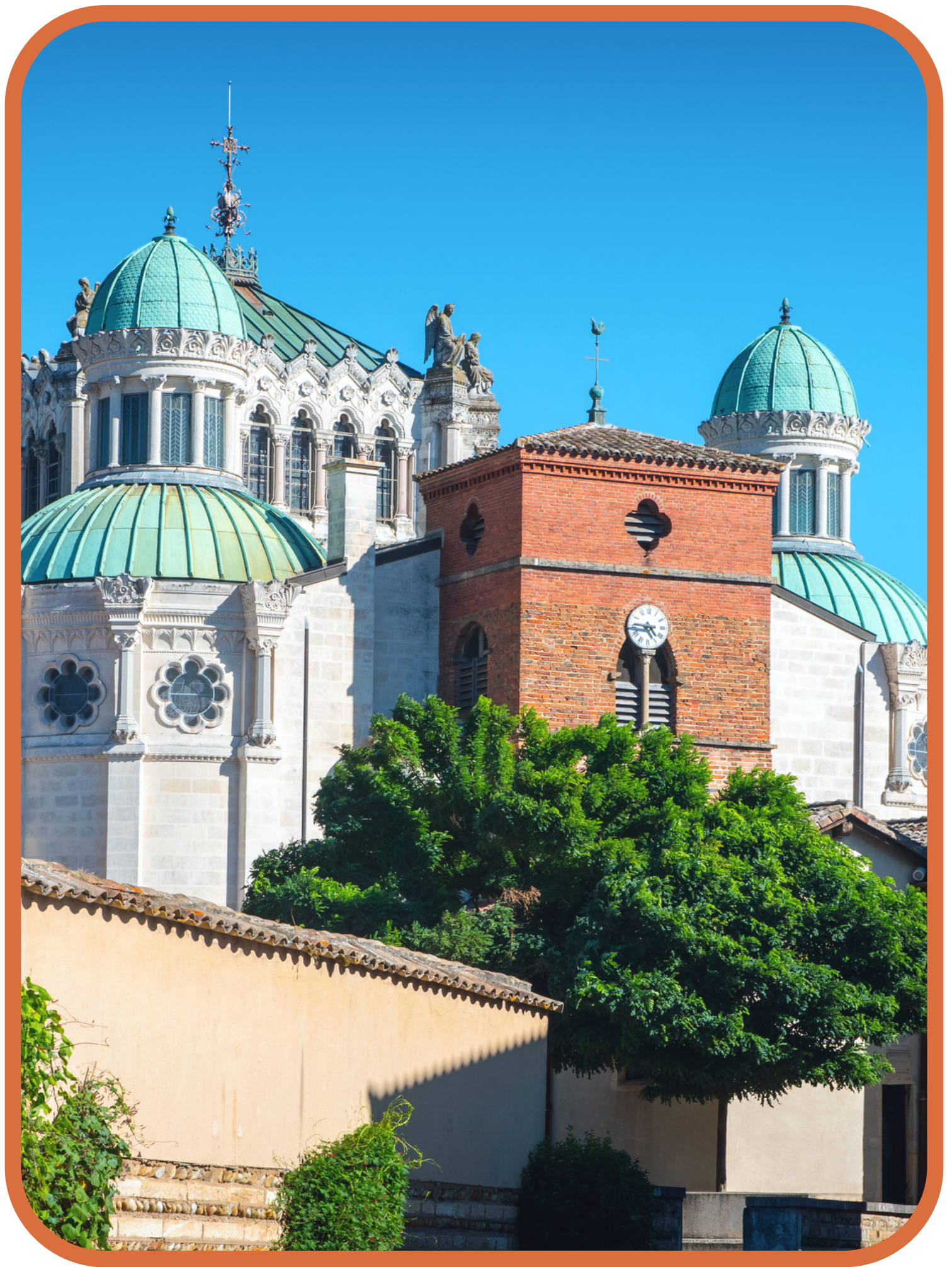
Basílica de Ars, Francia