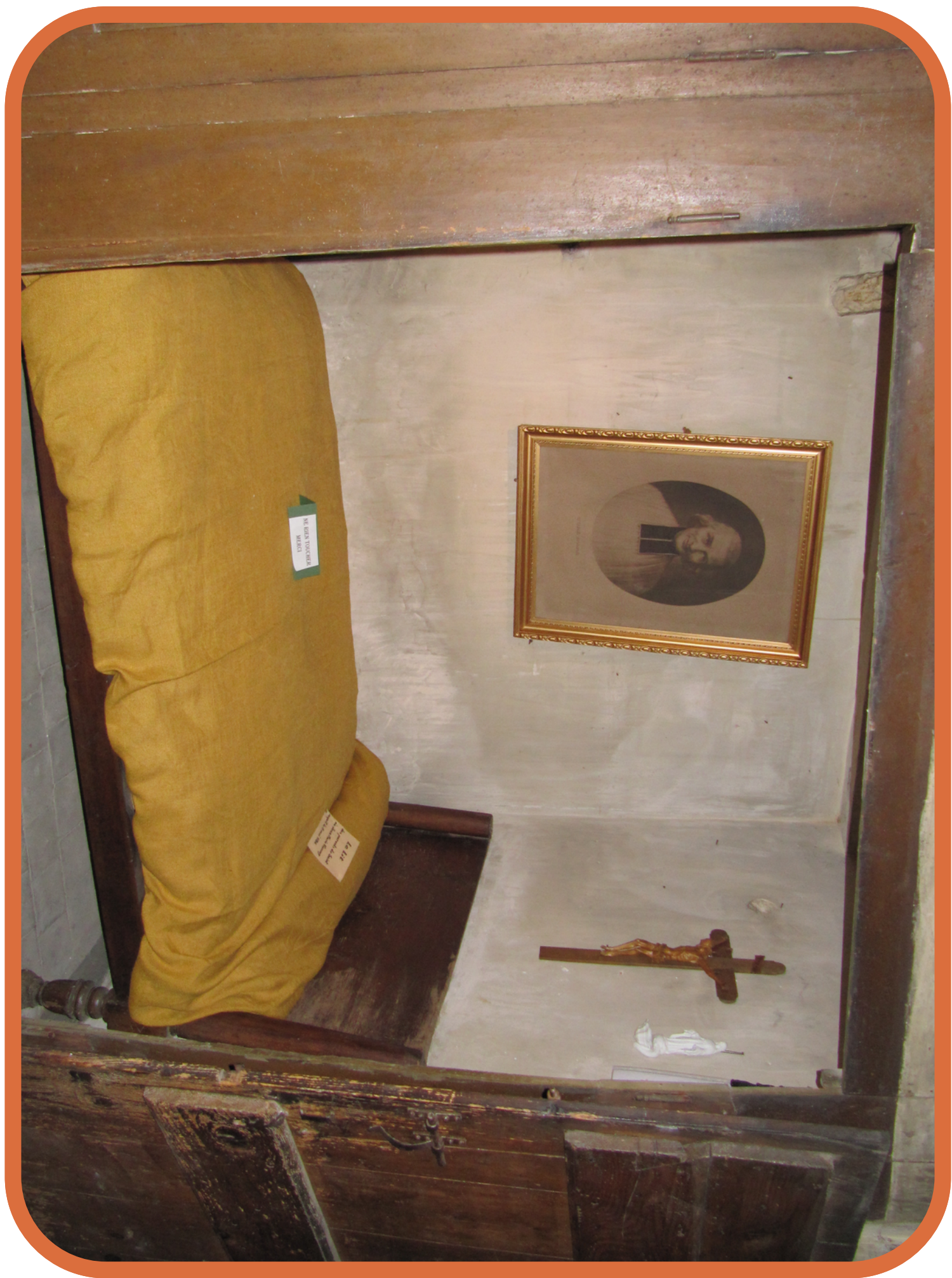
Dormitorio del cura de Ars